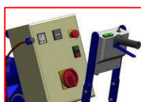
System kontroli prowadzenia na kierownicy