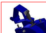
Opaska zaciskowa rury pyłowej