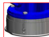
Ostona odsysająca pył