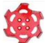
Dyski szlifujące – Ninja: zielony, niebieski, czerwony