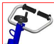
Regulowany uchwyt operatora