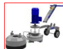
Prosty i szybki demontaż