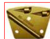
Segmety PCD do materiałów elastycznych