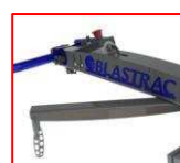
Regulowany uchwyt operatora