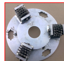
3-głowicowa tarcza tnąca