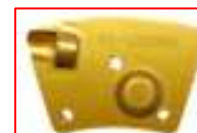
Segmety PCD do materiałów elastycznych