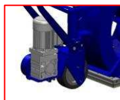
Mechanizm szybkiego podnoszenia maszyny