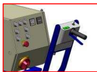
Możliwość regulacji uchwytu