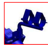
Opaska zaciskowa rury pyłowej