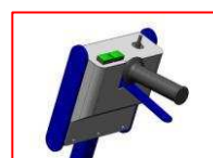
System kontroli w ręczce