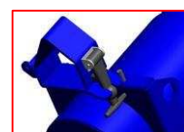
Opaska zaciskowa rury pyłowej