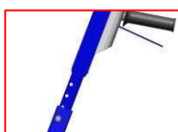
Regulacja uchwyty operatora