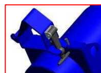
Opaska zaciskowa rury pyłowej