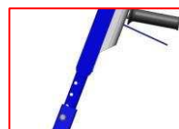
Regulacja uchwytu operatora